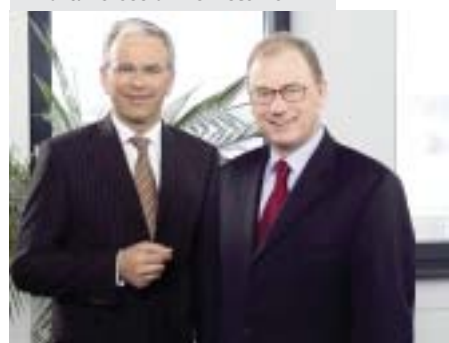
Hofer-Chefs Burger und Dold