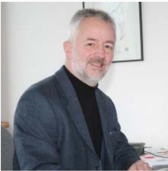
Focus-GF Mag. Klaus Fessel: Nach Billa-Kooperation setzt Adeg jetzt Werbe-Impulse.

■ ADEG überrascht mit gewaltigem Werbe-Plus