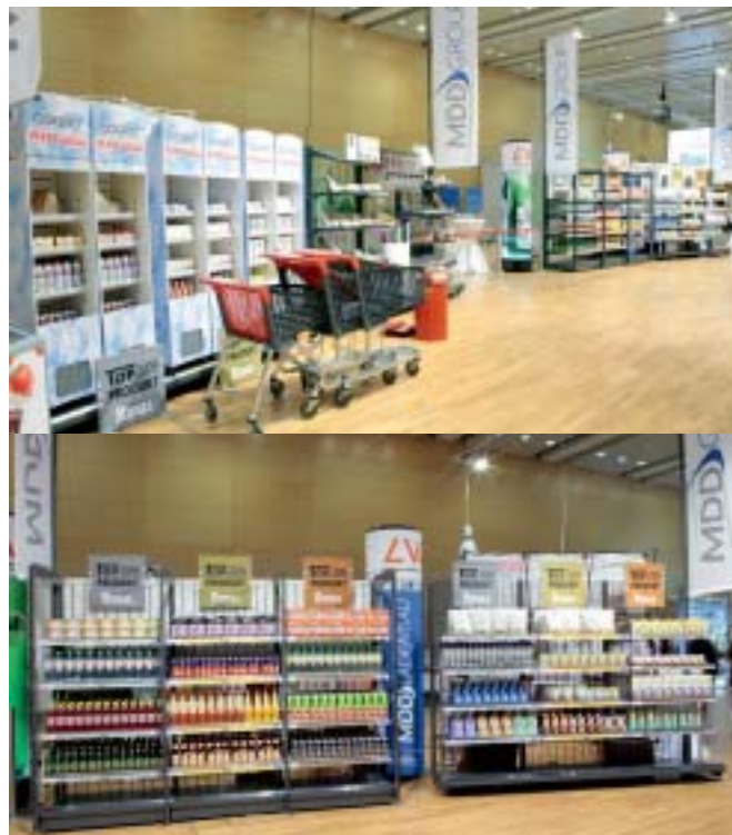
Hell, aufmerksamkeitsstark und innovativ: Der Supermarkt der Zukunft.

Neuheiten im Bereich Instore Kommunikation und